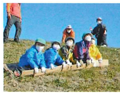
スーパーマンすべり