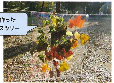
幼児が作った クリスマスツリー