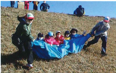
大人気！ ブルーシートすべり

しかし、草の生えている土手も近年の護岸工事により、一部がコンクリートのブロックになり、今回、活動した江戸川の土手のような所が少なくなっているのが現実です。子どもたちが自由に遊べる場所を残していきたいと考えます。